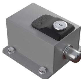
Trava Dog Steel