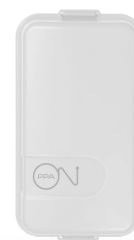
Módulo Contatto Smart ON